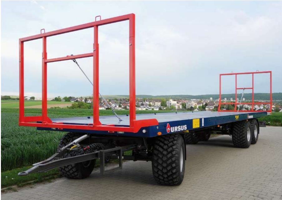
Quaderballenwagen 18 t mit Heckgitter und Radialbereifung