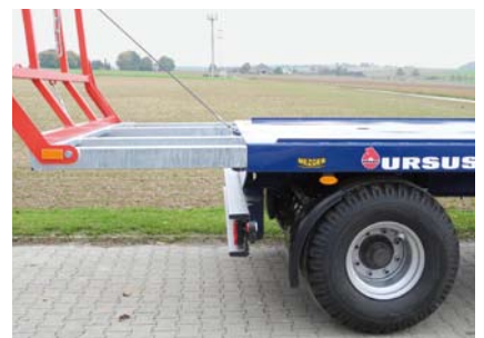
Auszug 900 mm, 2-Achs