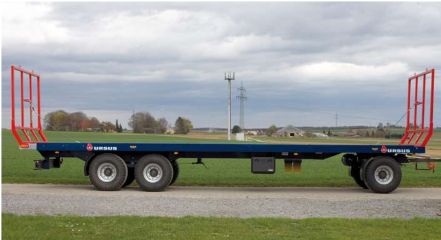
Rundballenwagen 22 t