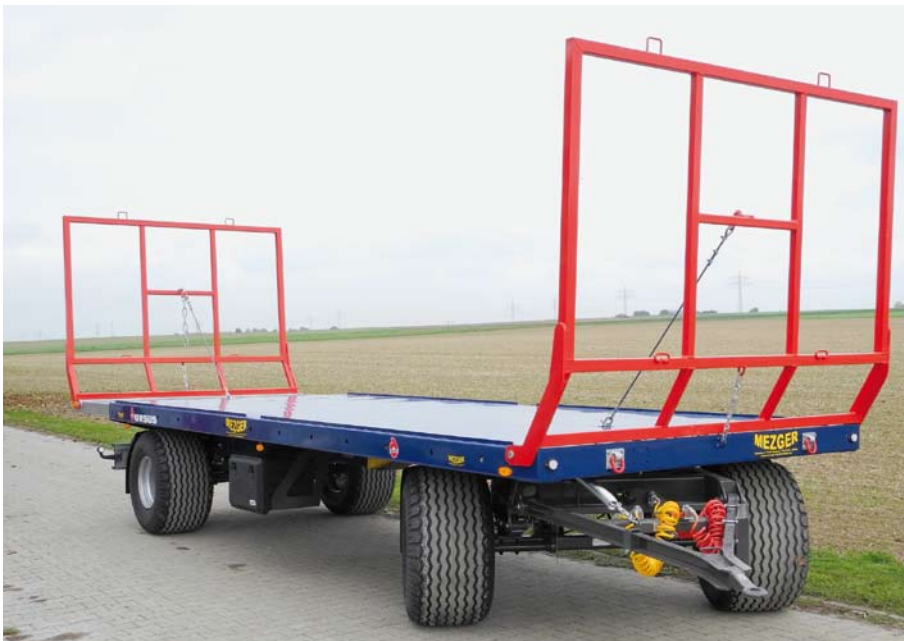
Rundballenwagen 16 t