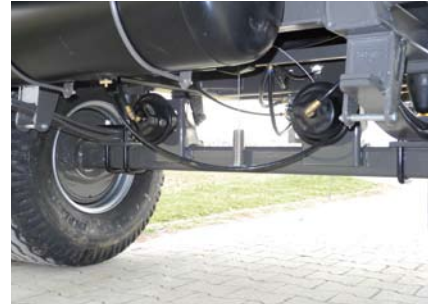
ALB-Regler, 2 Bremszylinder