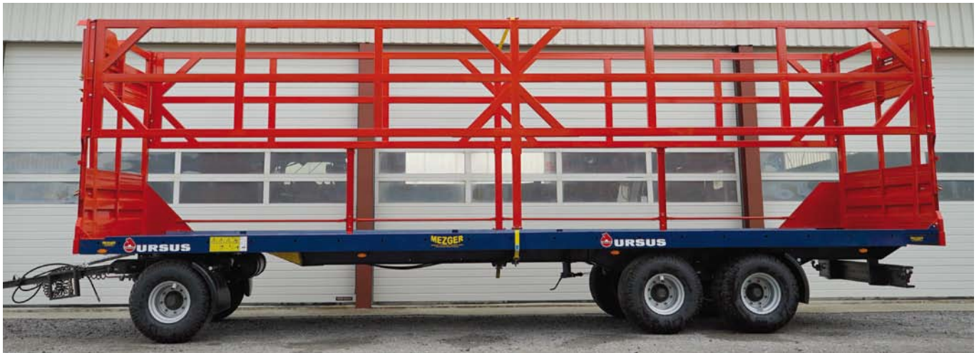
Ballenwagen 18 t mit hydraulischer Sicherung