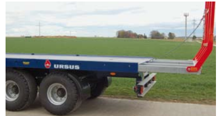
Auszug 900 mm, 3-Achs